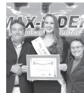
Funerária Bom Jesus e Plano divina Luz- Funerária e Plano Funerário