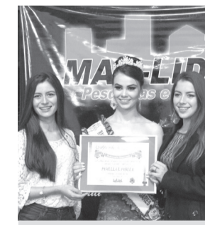
Pamela e Paolla - Fotógrafas