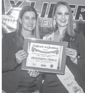
Transportes Thomaz - Agência de turismo