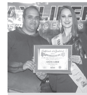
Grafica Lider- Gráfica