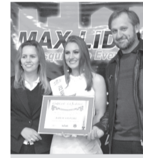
Agrícola Oliveira- Comércio de Máquinas Agrícolas