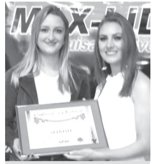
Sufranlu- Mini Mercado