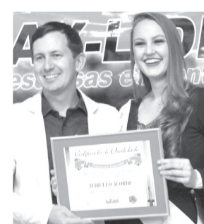
Loja Mabel- Loja de Confeções feminina, masculina, infantil e cama, mesa e banho