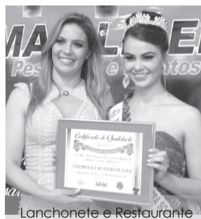
Lanchonete e Restaurante Suíço - Restaurante, Lanchonete e Buffet