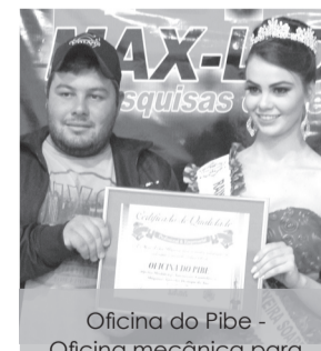
Oficina do Pibe - Oficina mecânica para automóveis, caminhões e máquinas agrícolas