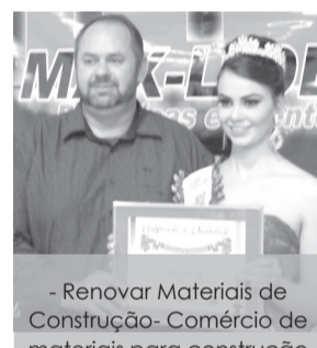
- Renovar Materiais de Construção- Comércio de materiais para construção e comércio de melhor atendimento