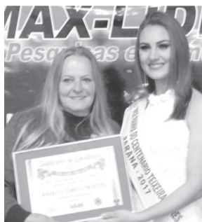
Madalena Flores e Presentes- Floricultura