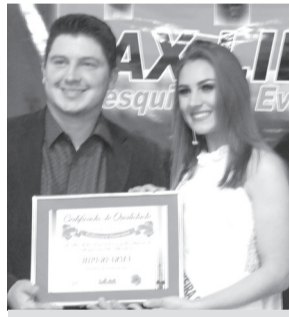
Hiperfarma - Farmácia