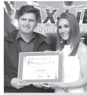
Farofoto- Foto, filmagem e telemensagens