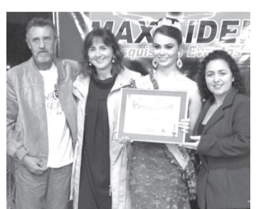
Rádio Najua Fm - Melhor rádio da região e Fm mais ouvida.