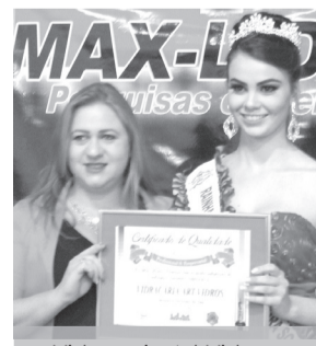
Vidraçaria Art Vidros - Vidraçaria