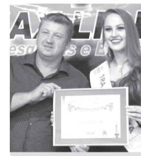
J.A Construtora- Construtora