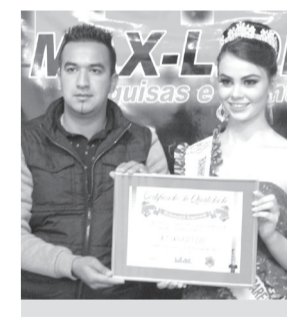
R Car Veículos- Comércio de veículos usados