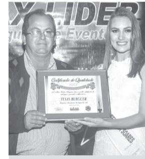
Texas Burger - Pizzaria e Pastelaria