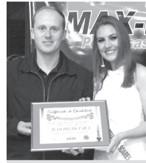
Auto Posto Anila - Posto de abastecimento