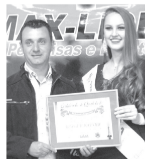
Digsat auto Center- Auto Center e comércio de pneus