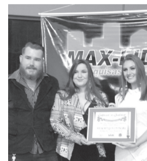
Wolski Botequin e Petiscaria- Bar Happy Hour e Choperia